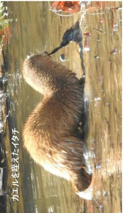
カエルを駆えたイタチ

このイタチは3月2日と4日にも現れて、池の中や田んぼの水たまりに顔を突っ込んでカエルを探していました。谷津田に着きアカガエルが鳴き始めてしばらくすると必すイタチがお出ましとパターンも決まっています。アカガエルの鳴き声も聞こえなくなるとイタチも姿をみせなくなりました。 このイタチは3月2日と4日にも現れて、池の中や田んぼの水たまりに顔を突っ込んでカエルを探していました。谷津田に着きアカガエルが鳴き始めてしばらくすると必すイタチがお出ましとパターンも決まっています。アカガエルの鳴き声も聞こえなくなるとイタチも姿をみせなくなりました。