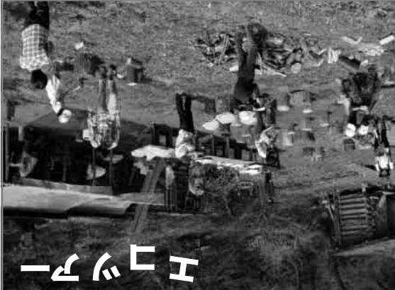
今年も、おもしろエコツアール